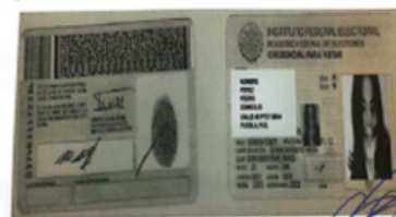
Ejemplo de Copia de Identificación Válida